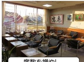
席数を増やし、 パーティションを完備!