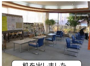
机を出しました。 新聞も二紙講読再開!

感染者数の減少に伴い、色々な所で日常がとりもどされつつあります。当館でもフリースペースの座席数を増やしたり、新聞の講読が再開したりと、少しずつ変化しています。