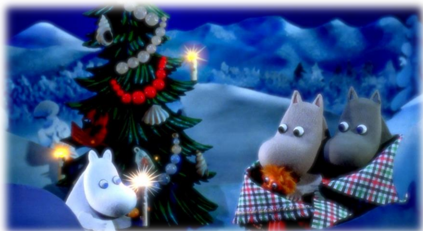
Filmkompaniet / Animoon Moomin Characters(TM)