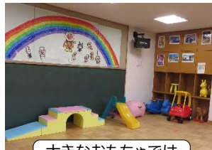
大きなおもちゃでは 遊べます♪